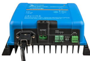
Phoenix Smart 12/50(1+1)