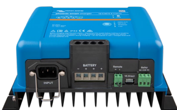
Phoenix Smart 12/50(3)